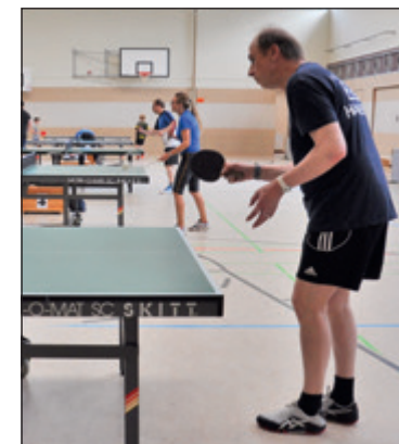
Fritsie in Action