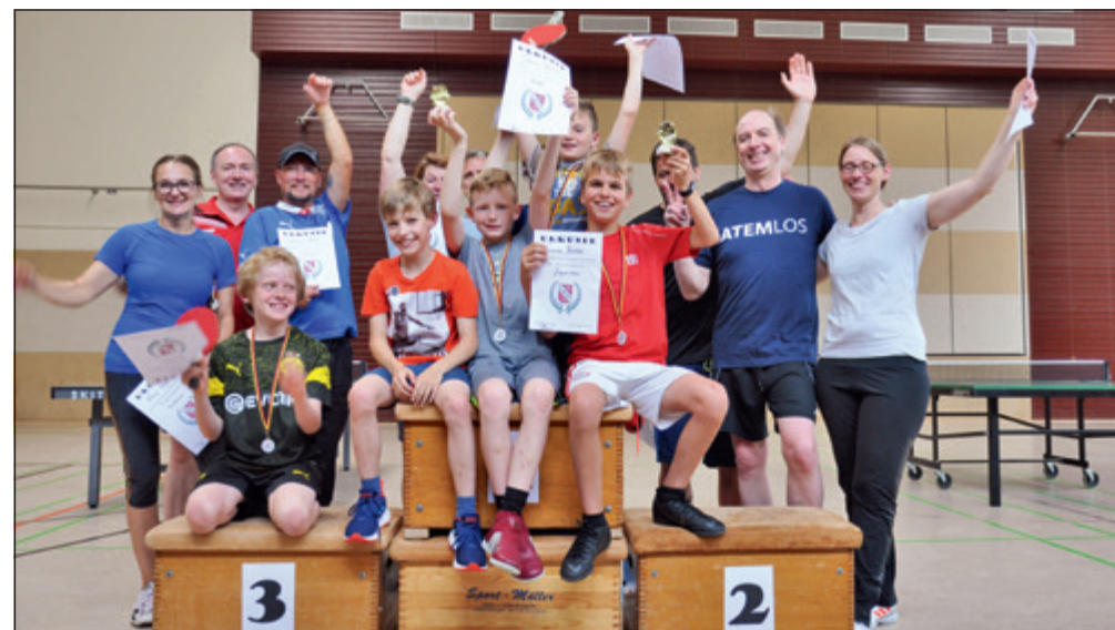
TT-Turnier für „Jedermann“, Siegerehrung