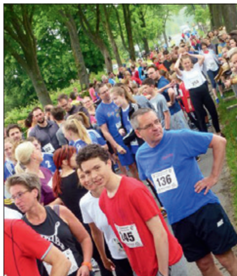
Die 5-km Walker warten auf den Start.