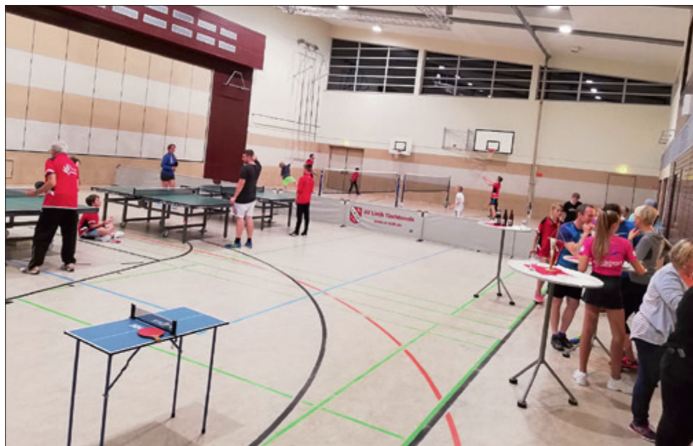
Nacht der schnellen Bälle

Fürs nächste Jahr werden wir weiter durch Werbung am Ball bleiben. Dazu gehört auch das 2. geplante TT-Turnier, diesmal mit etwas Besonderem. Lasst Euch einfach überraschen. Der Termin wird Anfang nächsten Jahres stattfinden und Anmeldungen werden rechtzeitig bekannt gegeben. Bis dahin gilt natürlich: schaut doch einfach mal unverbindlich bei uns rein, Trainingszeiten Mo/Fr und genaueres zum Spielbetrieb stehen im Eingang der Bgm. Hell Halle,