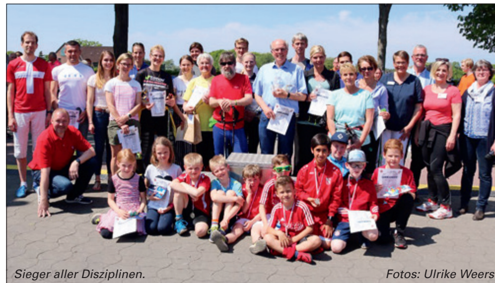
Sieger aller Disziplinen.