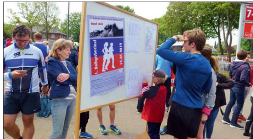
Alle persönlichen Bestzeiten zum Ablesen.