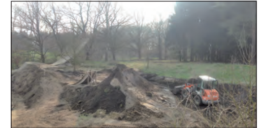
Radlader bei der Arbeit

Die Radsportsparte der SV Lieth war auch diesen Winter auf dem Floraring (Klein Nordende) sehr fleißig um diesen Sommer wieder gut fahren zu können. Wir haben versucht die Tabelline (geschlossene Sprünge) besser zu gestalten, damit die Neulinge die Line besser fahren können. Aber sie wurde auch für Fortgeschrittene erweitert. Ebenfalls haben wir eine große Doubleline (bestehend aus einem Absprung und ab-