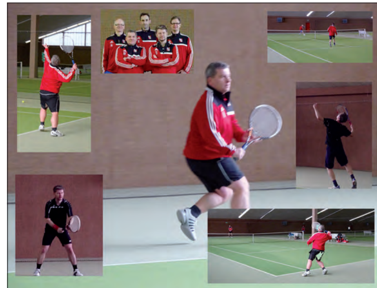
Impressionen Hallen Mannschaftsturnier Herren 40