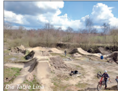
Die Table Line

weitere werden, der für die Anfänger und Fortgeschrittenen geeignet ist. Neben unserem kleinen Tricksprung wollen wir noch einen größeren bauen, wo man mehr Airtime (mehr Zeit in der Luft) besitzt und größere Tricks üben kann. Wie zu merken ist, ist dieses Hobby nicht nur mit fahren verbunden, jeder muss mal mit anpacken und helfen, die Sprünge zu pflegen und zu errichten.