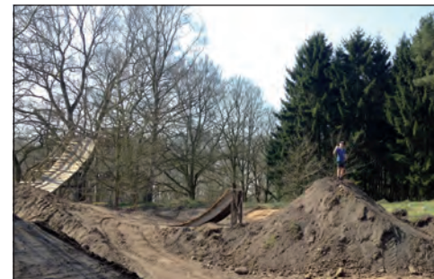
Tuck Nohand auf der Table Line