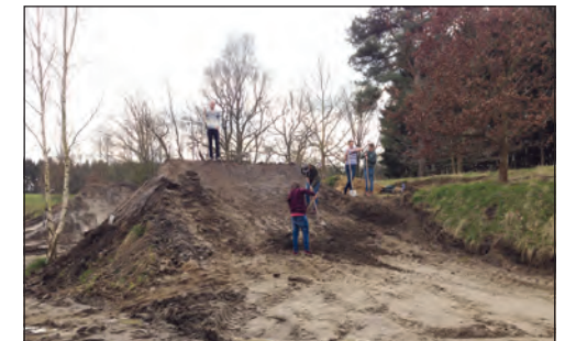
Schaufelarbeiten an der 2. großen Landung